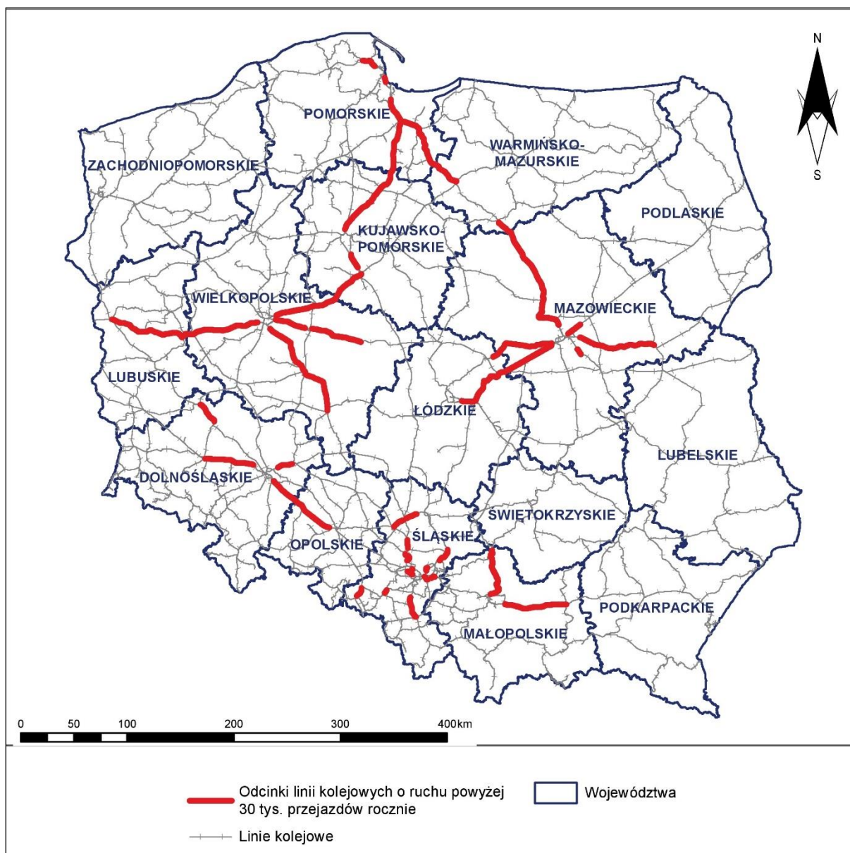
Rys. 1 Lokalizacja analizowanych linii kolejowych na tle województw Polski

Lokalizacje odcinków podlegających mapowaniu akustycznemu na terenie całej Polski oraz przedmiotowego województwa przedstawiono na rys. 1 ÷ rys. 2.