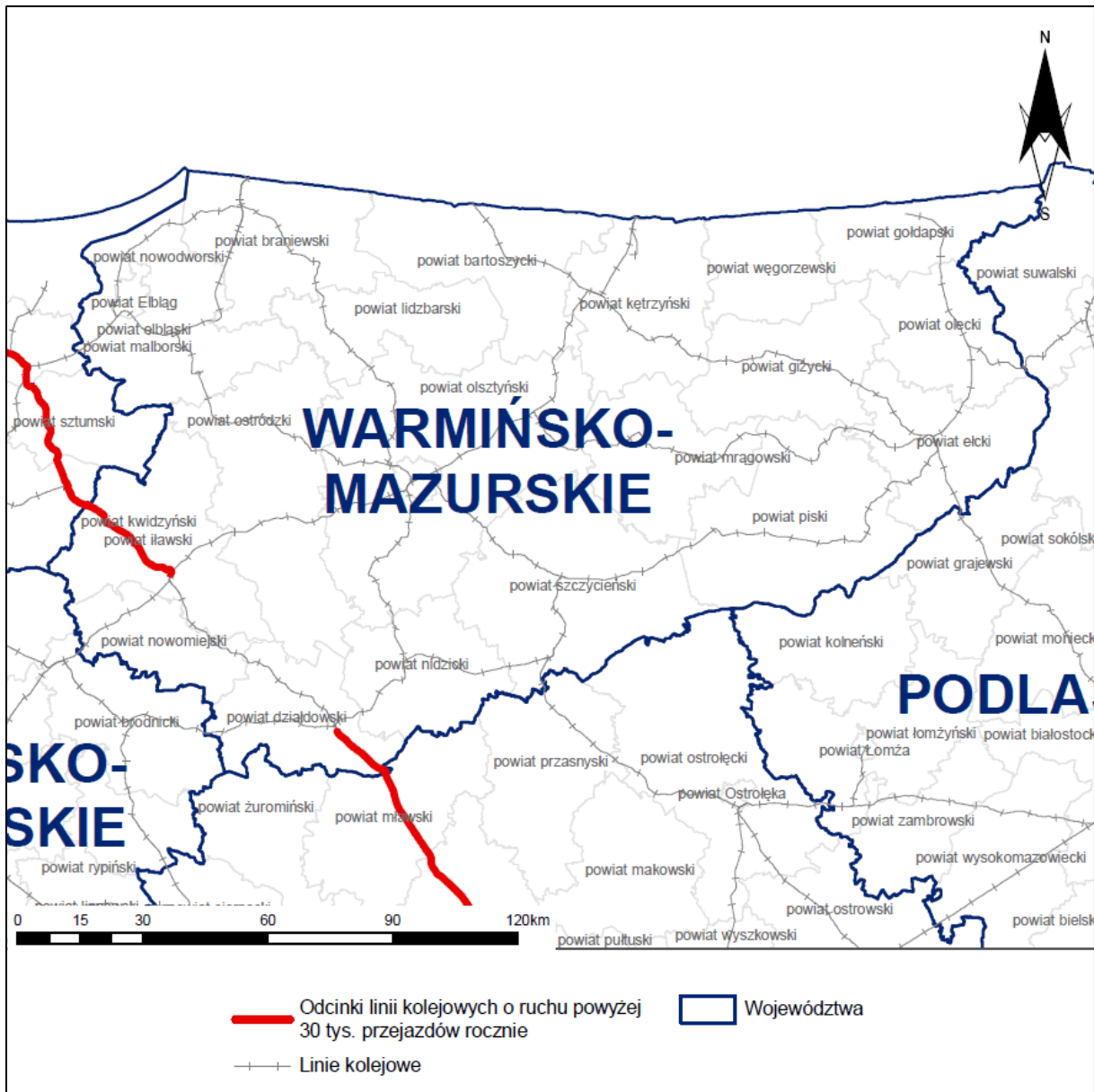
Rys. 2 Lokalizacja analizowanych linii kolejowych na tle analizowanego województwa

Województwo warmińsko-mazurskie zlokalizowane jest w północnej części Polski. Graniczy od zachodu z województwem pomorskim, od wschodu – z województwem podlaskim, a od południa – z województwem mazowieckim.