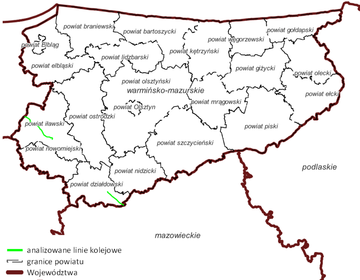
Rys. 6 Przebieg linii kolejowych o natężeniu ruchu większym niż 30 000 pociągów rocznie w województwie warmińsko-mazurskim, podział na powiaty

Zgodnie z polskimi przepisami, ochroną akustyczną objęte są tzw. obiekty oraz tereny wrażliwe na hałas, dla których ustala się wartości dopuszczalne poziomu hałasu.