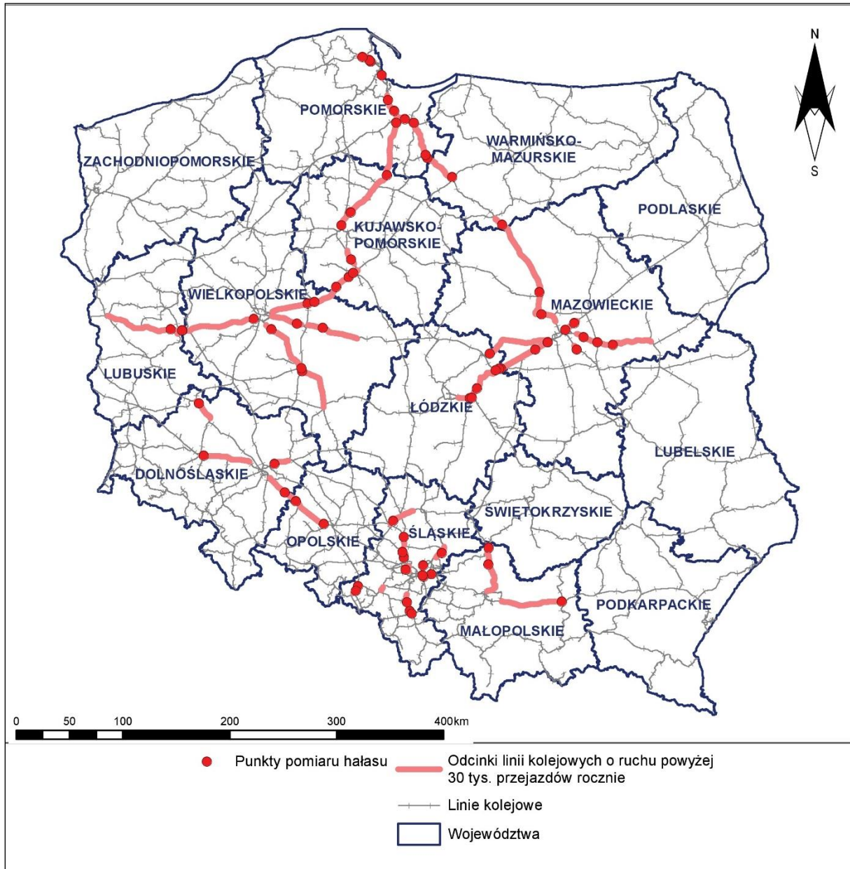
Rys. 3 Lokalizacja wszystkich punktów pomiarów hałasu kolejowego wykonywanych w ramach opracowania na tle województw Polski

Sprawozdania z przeprowadzonych pomiarów hałasu kolejowego w ramach analizowanego województwa zostały zamieszczone w załączniku Z5 do niniejszego opracowania. Informację o lokalizacjach punktów pomiarowych przedstawiono na rys. 3 ÷ rys. 4.