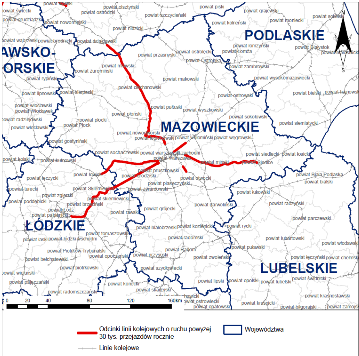
Rys. 2 Lokalizacja analizowanych linii kolejowych na tle analizowanego województwa

Województwo mazowieckie zlokalizowane jest w środkowo-wschodniej części Polski. Graniczy od zachodu z województwami – kujawsko-pomorskim, łódzkim, od północy – z województwem warmińsko-mazurskim, od wschodu – z województwami podlaskim i lubelskim, a od południa – z województwem świętokrzyskim.