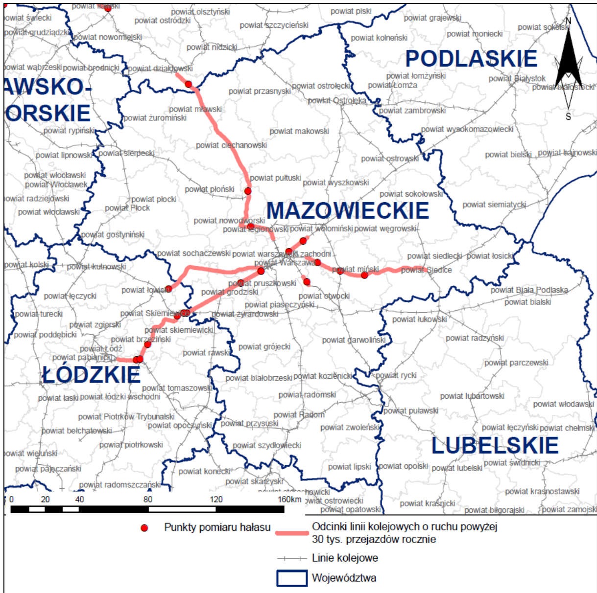
Rys. 4 Lokalizacja punktów pomiarów hałasu kolejowego wykonywanych w ramach opracowania na terenie analizowanego województwa

Właściwej weryfikacji modelu akustycznego dokonano wykorzystując proces kalibracji porównując metodę obliczeniową z metodą pomiarową. W procesie kalibracji wykorzystano wyniki pomiarów z 146 lokalizacji obejmujących odcinki jednorodne pod względem warunków eksploatacyjnych, przy których możliwe było wykonanie pomiarów hałasu zgodnie z wymaganiami procedury pomiarów ekspozycyjnych dźwięku w odniesieniu do pojedynczych zdarzeń akustycznych. Proces kalibracji przeprowadzono dla danych zarejestrowanych dla pory nocnej, która ze względów akustycznych jest bardziej newralgiczna. Warunek konieczny równoważności metody pomiarowej i obliczeniowej, zgodnie z zapisem punktu H „Procedura obliczeniowa” załącznika nr 3 do rozporządzenia