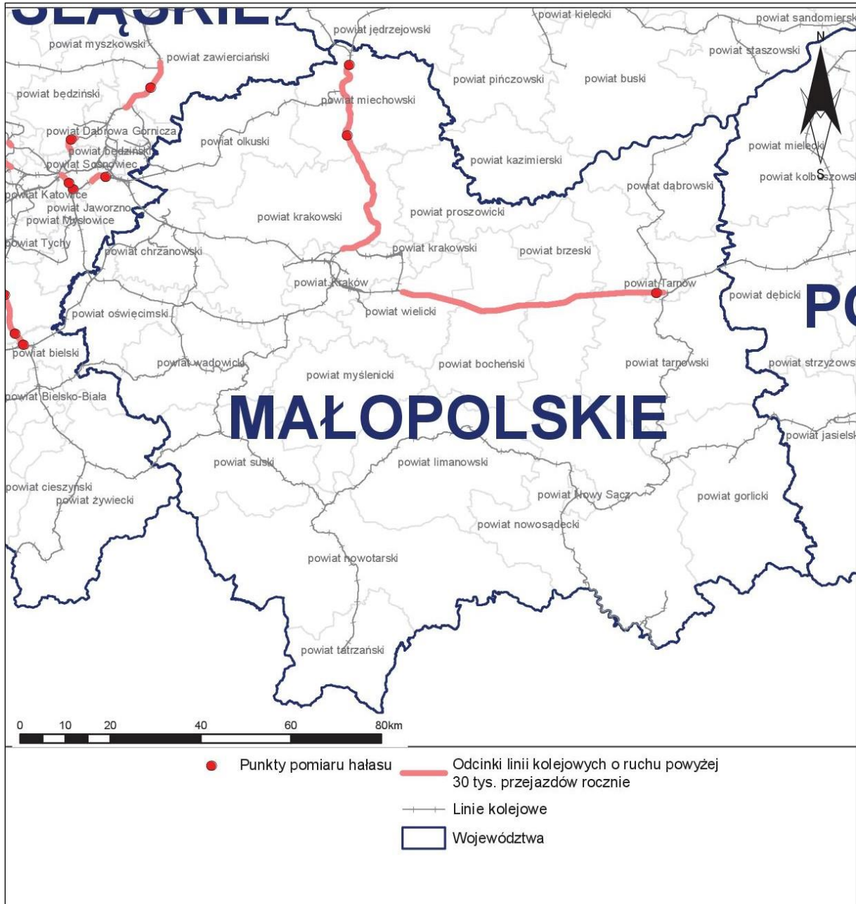
Rys. 4 Lokalizacja punktów pomiarów hałasu kolejowego wykonywanych w ramach opracowania na terenie analizowanego województwa

Właściwej weryfikacji modelu akustycznego dokonano wykorzystując proces kalibracji porównując metodę obliczeniową z metodą pomiarową. W procesie kalibracji wykorzystano wyniki pomiarów z 146 lokalizacji obejmujących odcinki jednorodnie pod względem warunków eksploatacyjnych, przy których możliwe było wykonanie pomiarów hałasu zgodnie z wymaganiami procedury pomiarów ekspozycyjnych dźwięku w odniesieniu do pojedynczych zdarzeń akustycznych. Proces kalibracji przeprowadzono dla danych zarejestrowanych dla pory nocnej, która ze względów akustycznych jest bardziej newralgiczna. Warunek konieczny równoważności metody pomiarowej i obliczeniowej,