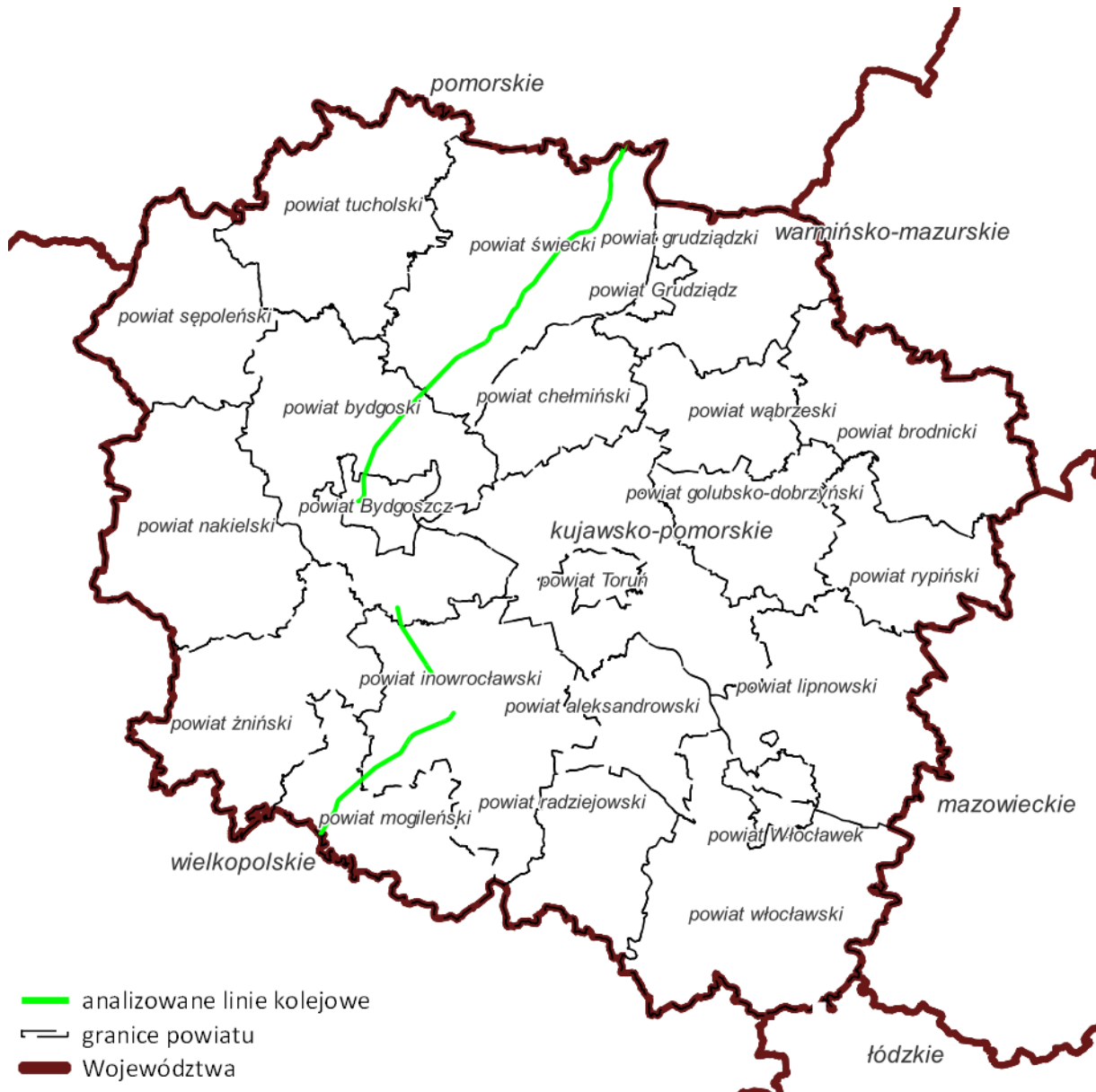
Rys. 6 Przebieg linii kolejowych o natężeniu ruchu większym niż 30 000 pociągów rocznie w województwie kujawsko-pomorskim, podział na powiaty

Zgodnie z polskimi przepisami, ochroną akustyczną objęte są tzw. obiekty oraz tereny wrażliwe na hałas, dla których ustala się wartości dopuszczalne poziomu hałasu.