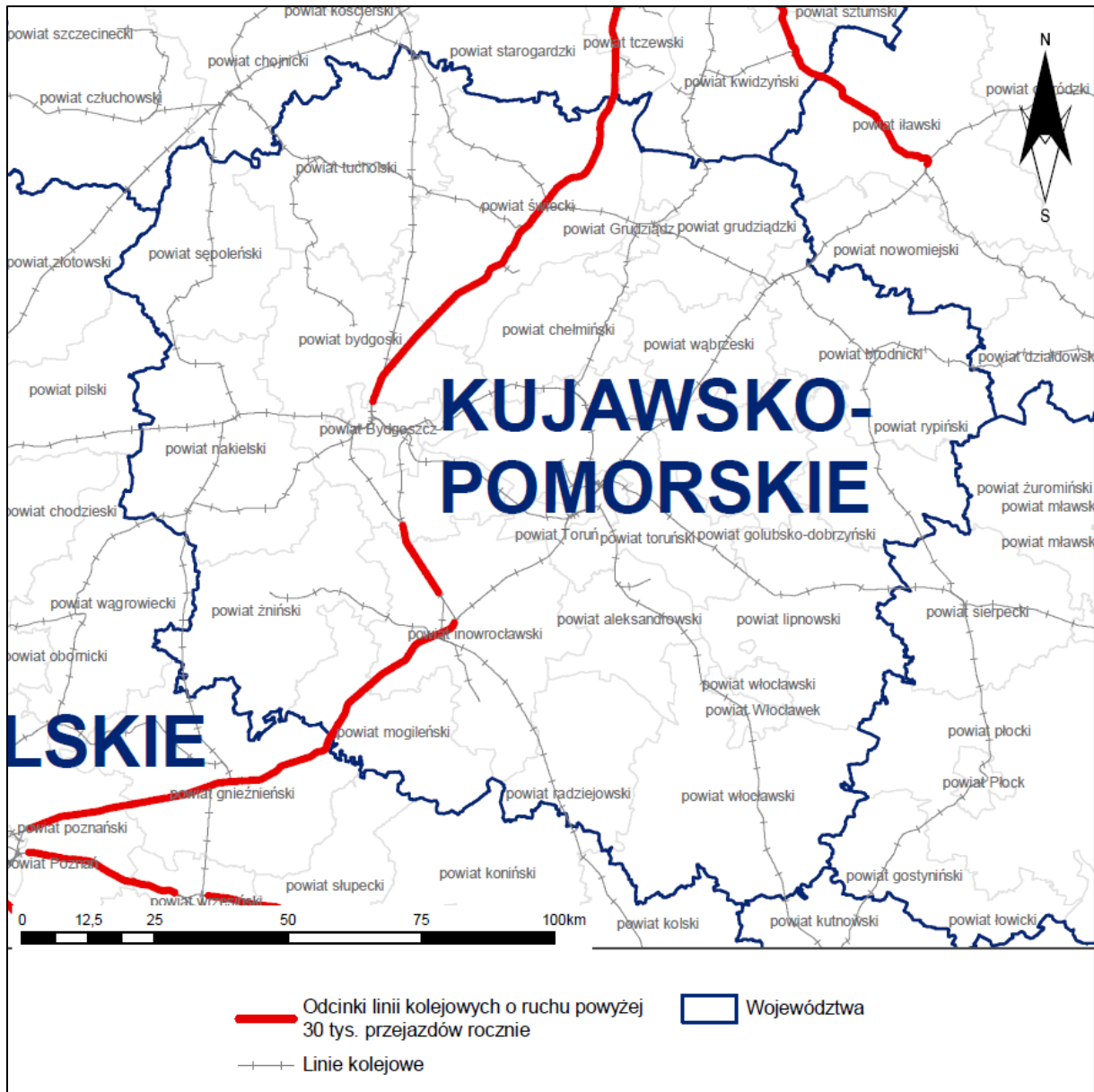
Rys. 2 Lokalizacja analizowanych linii kolejowych na tle analizowanego województwa

Województwo kujawsko-pomorskie zlokalizowane jest w centralnej części Polski. Graniczy od zachodu - z województwem wielkopolskim, od północy – z województwem pomorskim, od wschodu – z województwem mazowieckim, a od południa – z województwem łódzkim. Administracyjnie województwo podzielone jest na 19 powiatów, w tym 4 miasta na prawach powiatu, oraz 144 gminy. Powierzchnia województwa wynosi 17 971 km 2 . Dane o liczbie ludności przedstawiono w Z1.